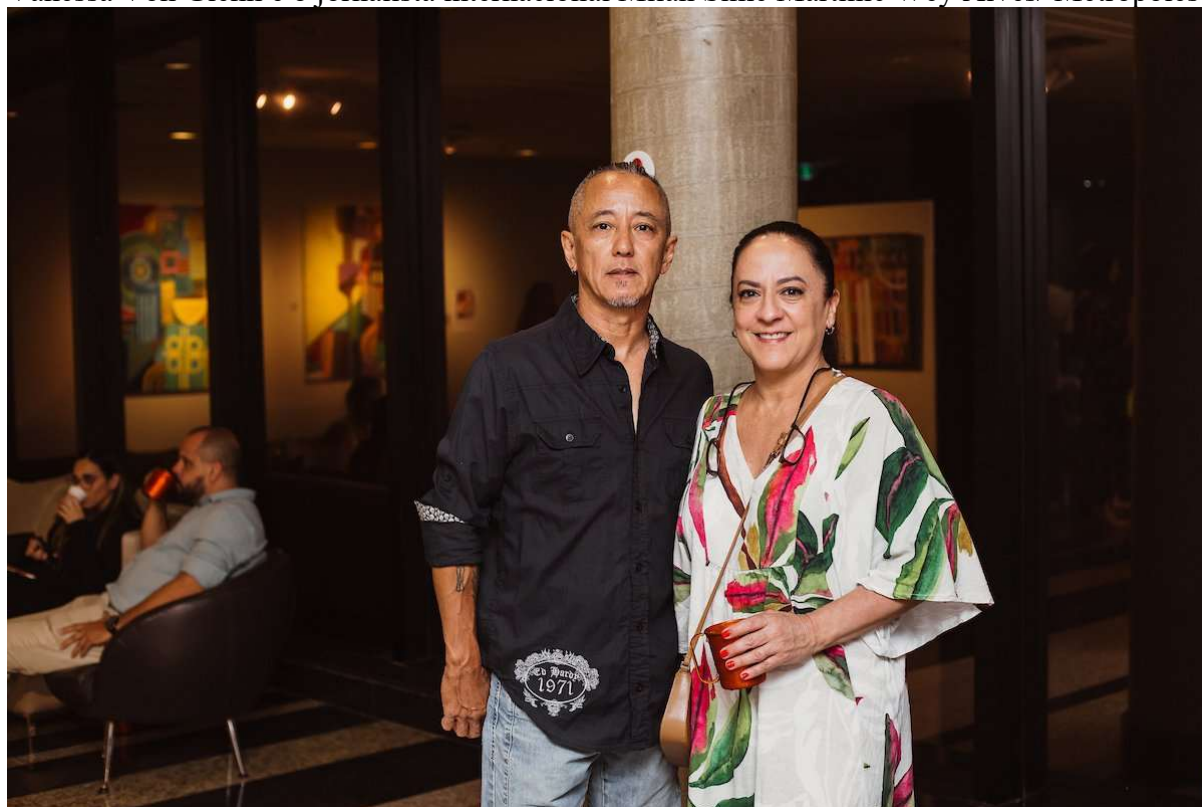
Alex Takahashi e Raquel Figueiredo Wey Alves/ Metr6poles