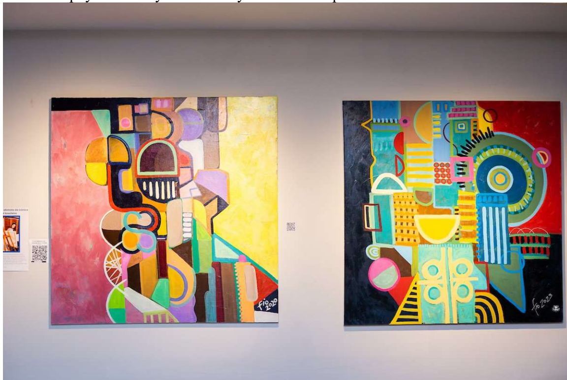
As obras da artista homenageiam Bras lia